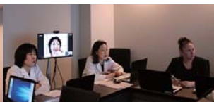
▲出張中のドクターは、テレビ会議システムを利用して説明会に参加しました。オーク会では、このシステムを患者様とのコミュニケーションツールとして活用することを検討中です。詳細が決まり次第、ご案内させていただきます。